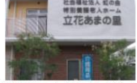
福祉用具レンタルサービスさぼーと

特養、ショートステイ、デイサービス、認知症型デイサービス、訪問介護、福祉用具レンタル、ケアプラン