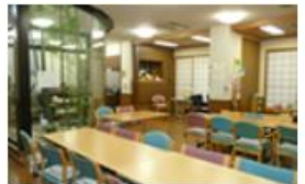
デイサービス木かげ