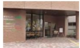
ヘルパーSTわかくさ