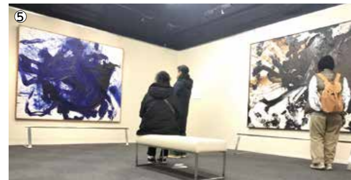
白髪一雄記念室 (10時~17時 入館は16時30分まで。火曜日休館) 観覧料: 一般200円、65歳以上・大高生100円、中学生以下無料、障害者手帳半額・介助者1名無料。絵の入れ替え、他の展示会との関係で休館あり、確認のうえお越しください。

時間があれば、もっと遊びたかったのに…というのが感想です。まだ行かれていない方は、是非!! 一人で