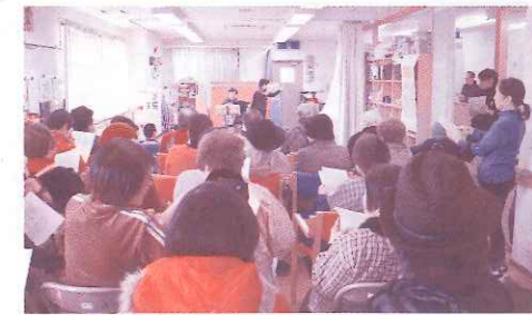
本田まつり&餅つき大会

ンケート用紙や、本田キャラクター「ゆるキャラ」募集、リニューアル「こんな診療所にしてほしい」コーナーなどが作られ多くの人が見入っていました。 午後からはダイケア室を会場に、バリ舞踊、手品、歌声等が披露され、楽しいひと時を過ごすことが出来ました。バリ舞踊を初めて見る方がほとんどで、洗練された踊りは、大変賞ばれました。