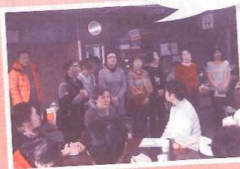
2月1日 杭瀬支部 新春のつどい