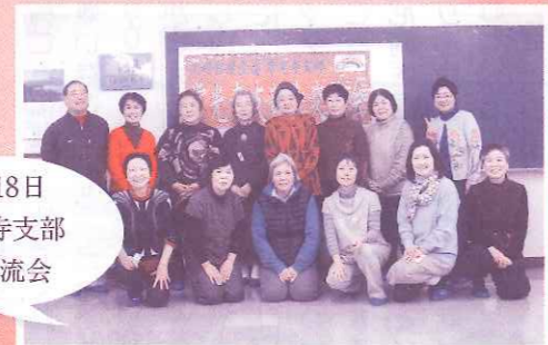
1月18日 常光寺支部 大交流会