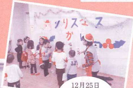
12月25日 あまっこ X'mas会