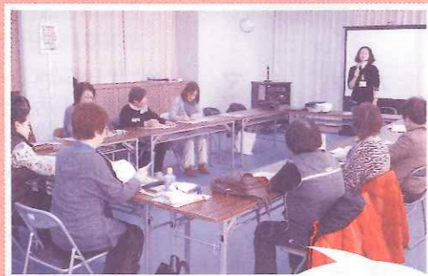
12月18日 健康づくり委員会 認知症の学習会