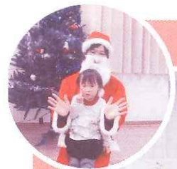
12月25日 カルチャー X'mas会

2015年6月28日(日) 13:00~17:00 場所: 尼崎市中小企業センター