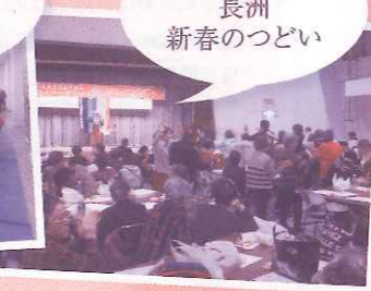
2月14日 長洲 新春のつどい