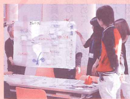
グループワークの発表

今年度2回目の「介護職員初任者研修」が、受講者数12人でスタートしました。全くの未経験の方から介護の仕事を目指す方、無資格ながら仕事をされていた方、身近でご家族の介護を体験された方などいろんな思いで研修を受けられます。これから2月の研修終了まで、お互い励ましあいながら資格取得をめざして頑張ります。