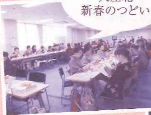
2月11日 大庄北 新春のつどい