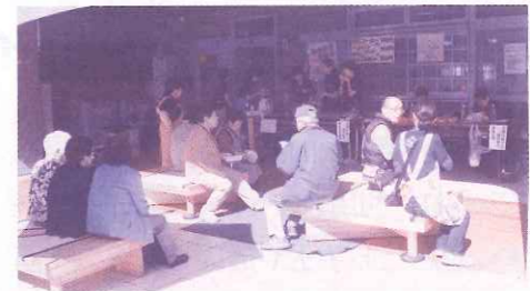
うきうき東尼崎診療所まつりで

秋はおまつりシーズンとなりました。合併40周年にちなみ、東尼崎地域、長洲地域ではそれぞれ組合員、地域住民とともに大きなおまつりを開催しました。「うきうき東尼崎診療所まつり」では、250人を超える方の参加があり、皆さん、午前中は模擬店の美味しいお料理や健康チェック、バザーを、お昼からはちんどん屋さんの元気溢れる演奏や、沖縄舞踊を楽しんでいました。最後にはお楽しみの大抽選会! 「とても楽しかった!」、診療所のことをよく知れた。また、「こんななんてな」と参加された方の感想も。