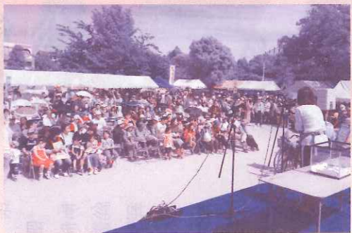
潮江わくわく健康まつり

準備も大変だったけど、その準備でさまざまな人とのつながりができたと感じる。その集大成が合併40周年記念レセプションだったと思う。