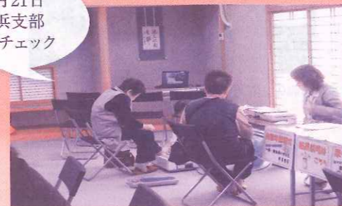
11月21日 尾浜支部 健康チェック