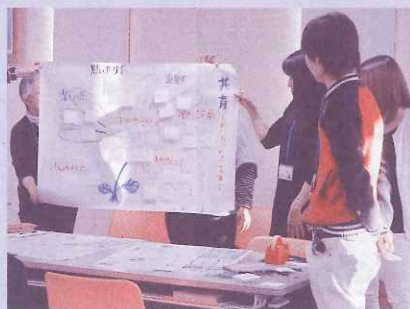
グループワークの発表

今年度2回目の「介護職員初任者研修」が、受講者数12人でスタートしました。全くの未経験の方から介護の仕事を目指す方、無資格ながら仕事をされていた方、身近でご家族の介護を体験されていた方などいろんな思いで研修を受けられます。これから2月の研修終了まで、お互い励ましあいながら資格取得をめざして頑張ります。