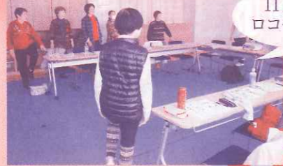
11月20日 ロコモ学習会