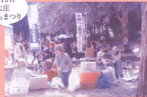
11月3日 大庄 こどもまつり