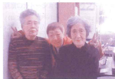
▲ナニワご近所さんのボランティアさんたち

ナニワご近所さんが発足して 2年3カ月。発足時から、ずつ とSさんの支援に毎週2回交代 で支援に入っている3名の支援