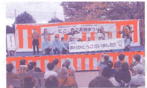
にこにこ長洲まつりより

「にこにこ長洲まつり」では心配されていたお天気も何とか持ちこたえ、来場者数も約1,150人を数える盛大なおまつりに。カレーうどんや焼きそば、バナナのたき売り、健康チェック、楽しい子どもコーナーなどの模擬店も。ステージでも軽音楽の演奏や、フラダンス、そして長洲診療所職員による、踊るぽんぽこりんのダンスなどで会場全体が大盛り上がり。最後には、豪華賞品の当たる大抽選会も行われ、皆さん当選発表に一喜一憂…。 最後まで、会場全体が「にこにこ」の、素晴らしいおまつりとなりました。