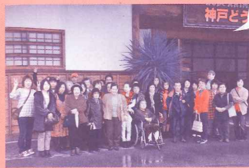
11月9日 戸ノ内支部 バスツアー