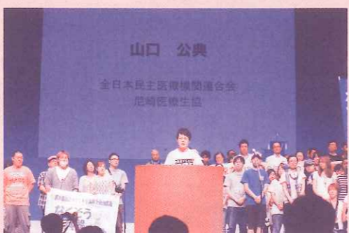
原水爆禁止2014世界大会

長濱 戦後70年、そして阪神淡路大震災20年だしね。被爆70年という節目でもある。特定秘密保護法が国会を通り、12月中旬に施行となったし、昨年7月には、集団的自衛権について閣議決定もされた。今まで通るはずがなかった法案や考え方が通ってしまった。戦後70年、戦争しなかったという、このこと自体こそ誇るべきことなのに…。