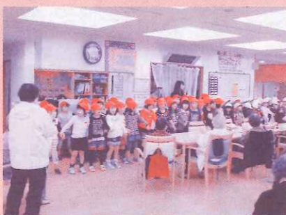
あまの里に小学校児童を迎えて

11月、地域交流の一環で近隣にある下坂部小学校の1年生62名があまの里に来られ、利用者さんと一緒に昔遊びをしました。最近、昔よく遊んだお手玉やおはじき・コマ回しなどで遊ぶ子どもが少なくなってきたようで小学生の子どもたちは利用者さんが回したコマを見て目を丸くして喜んでいました。利用者さんも子どもたちに「昔よく遊んだんや。コツはなあ～」と言いながら楽しそうに教えておられました。小学生と一緒に童心に返って楽しんでおられる様子を見ていて、世代を超えた交流の大切さを実感しました。