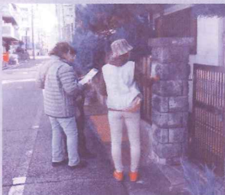
地域訪問する虹の会職員

立花あまの里地域訪問行動が11月からスタートしました。3週間で、訪問行動に虹の会職員38人が参加、地域の128の方と対話できました。「生協は知っているけど虹の会は知らない」という方がほとんどでした。引き続き、訪問行動などで虹の会、立花あまの里をアピールしていきます。