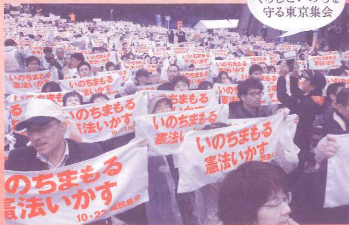
10月23日 くらしといのちを守る東京集会