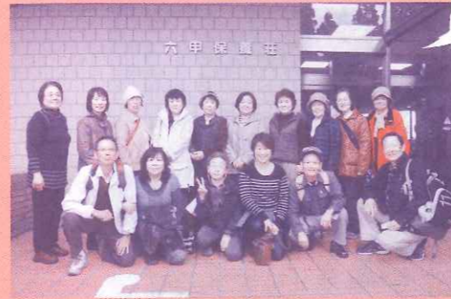
11月6日 富松支部 バスツアー