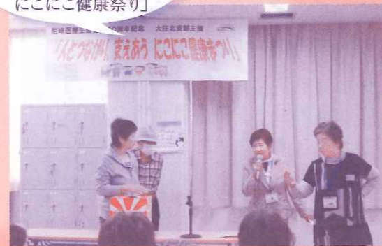
10月26日 大庄北支部主催 「人とつながり、支えあう にこにこ健康祭り」