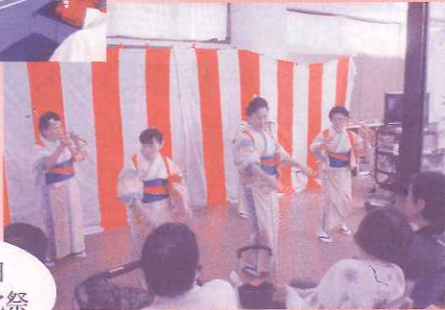
10月19日 ふる里文化祭